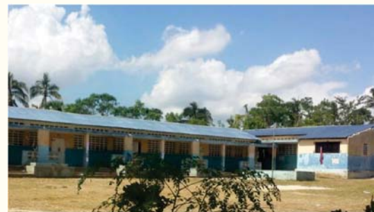
École Nationale Moinson – L'Asile

Sur demande du Conseil Electoral Provisoire (CEP), le BMPAD a procédé du 2 au 13 novembre 2016, à la remise en état de fonctionnement de divers espaces devant servir de centres de vote pour les élections du 20 novembre 2016. En ce sens, 63 toitures ont été réparées, soit 45 dans le département des Nippes et 18 dans le département du Sud-Est.