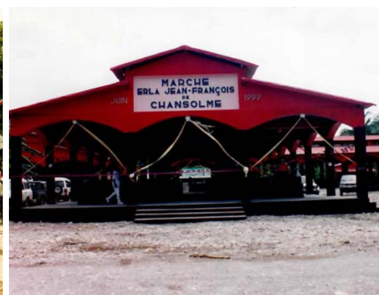
Construction du marché de Chansolme