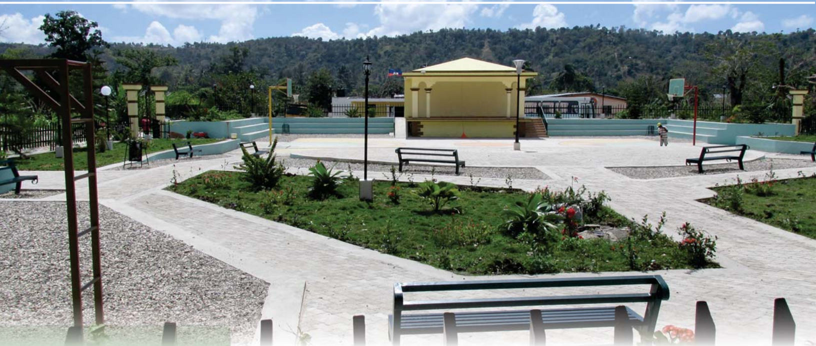
Place publique de Fonds des Nègres

Le Bulletin d'Informations du BUREAU DE MONÉTISATION DES PROGRAMMES D'AIDE AU DEVELOPPEMENT