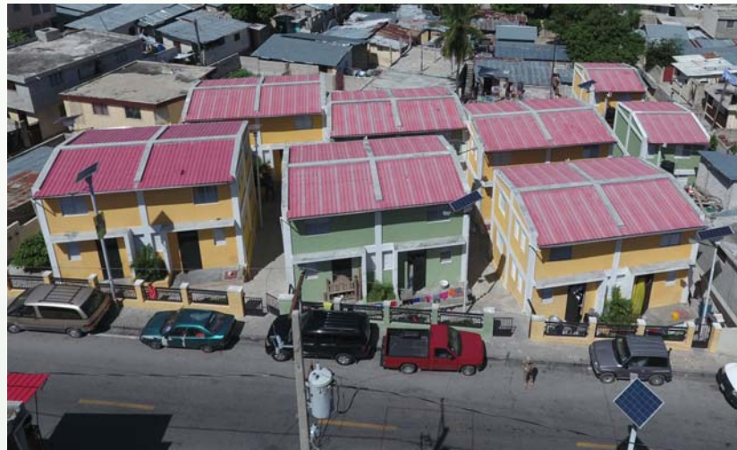
Logements collectifs de la rue Nord Alexis