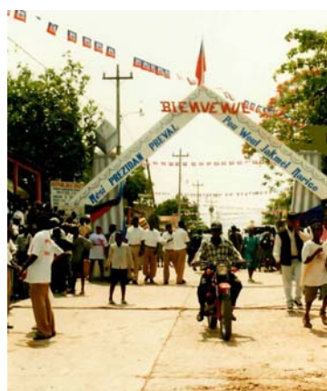
Réhabilitation de la route Jacmel - Marigot