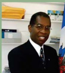
Antonio RODRIGUE Ministre des Affaires Etrangères et des Cultes, Membre