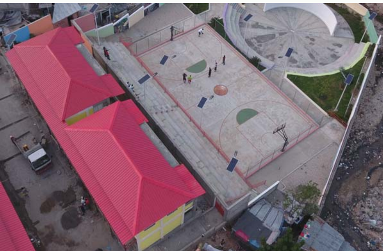
Construction de logements collectifs et d'un espace de loisir à Delmas 32